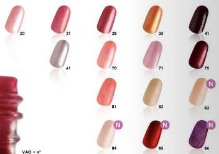
VAO + n°